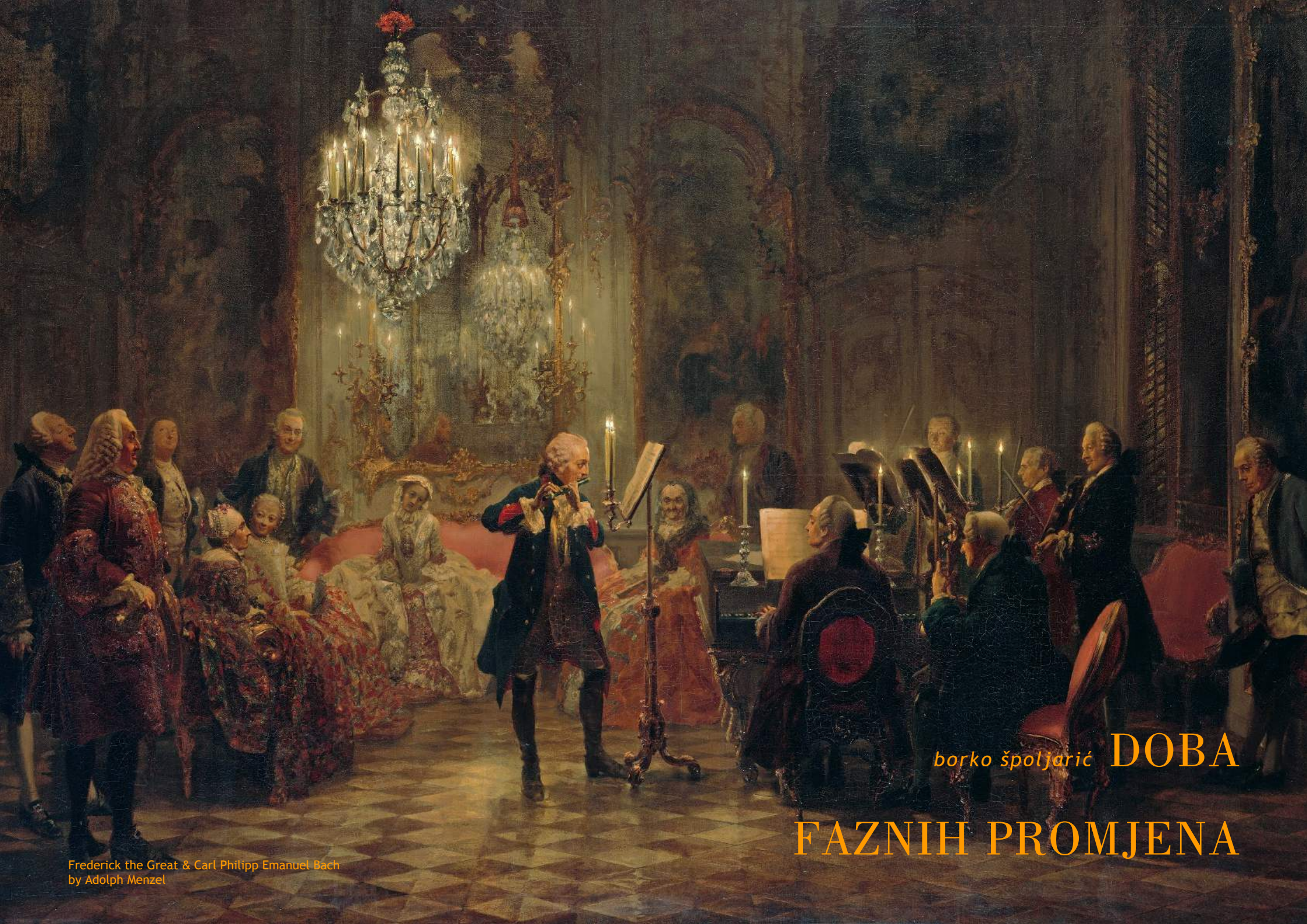
Frederick the Great & Carl Philipp Emanuel Bach by Adolph Menzel